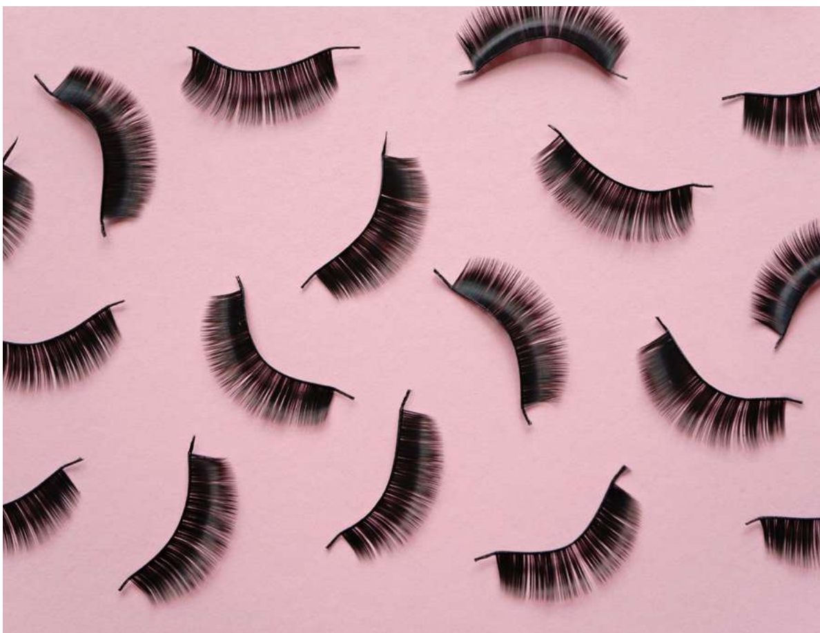
BLACK FALSE LASHES STRIPS ON PINK BACKGROUND